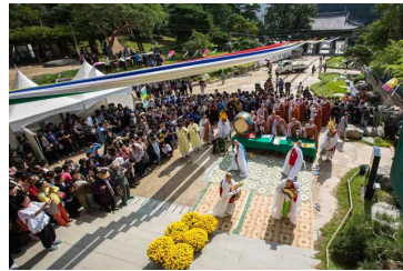
<그림 1> 봉은사 생전예수재

봉은사 생전예수재를 콘텐츠화하는데 필요한 방법과 범위를 다음과 같이 단계적으로 제안하고자 한다.