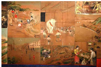
<그림 6> 흥천사 감로왕도 부분

로 옮겨 거울처럼 비춘다. 또한 근래에 조성된 장곡사 하대웅전의 감로왕도 또한 세월호 침몰, 진도 팽목항에서 세월호 영령들을 애도하는 모습들과 함께 광화문 촛불집회는 물론 5·18민주화운동 등 현대사의 주요 사건들이 묘사되어 있다. 45)