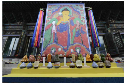
생전예수제 무대 전경